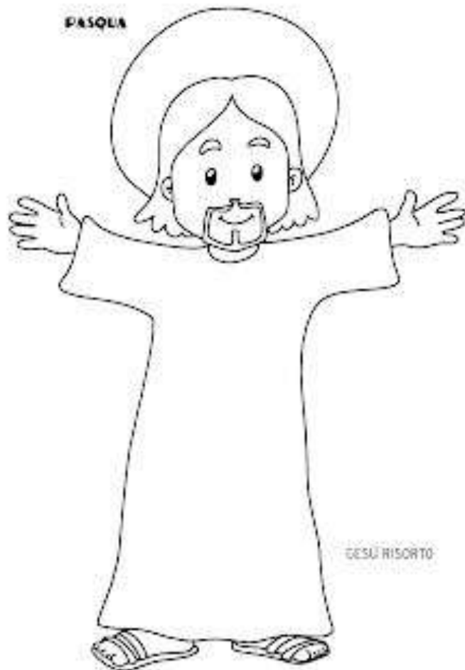
IMMAGINE DI GESU' DA STAMPARE, RITAGLIARE, COLORARE E INSERIRE DENTRO AL CUORE

Oppure stampa una delle due sagome qui sotto riportate (bambino o bambina) e divertiti a personalizzarla per renderla simile a te.